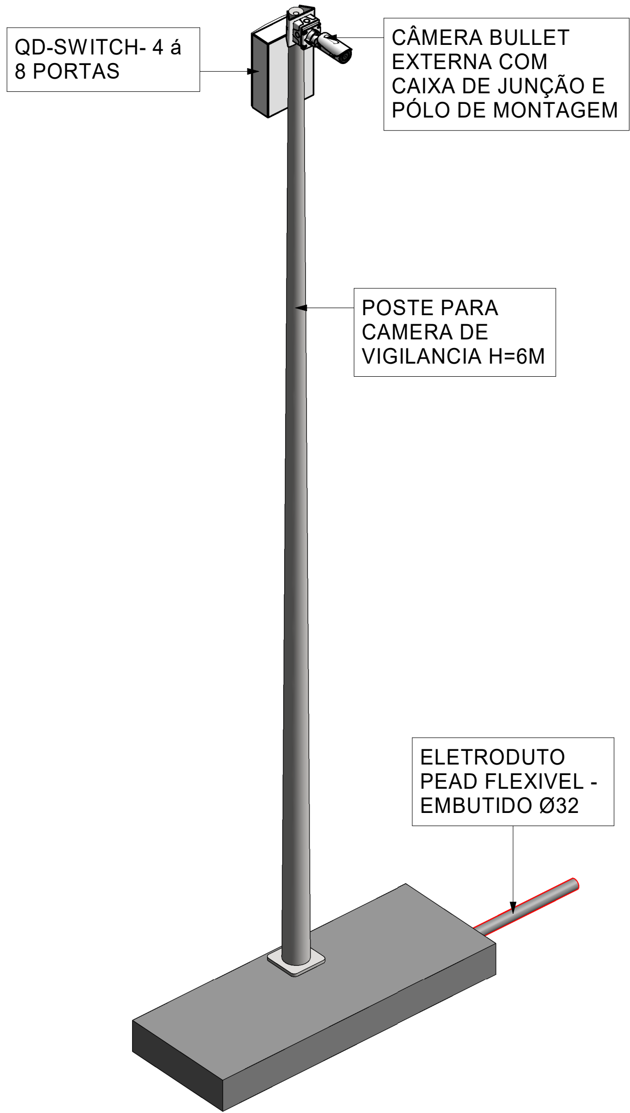
3D-Poste Com Camera e Switch